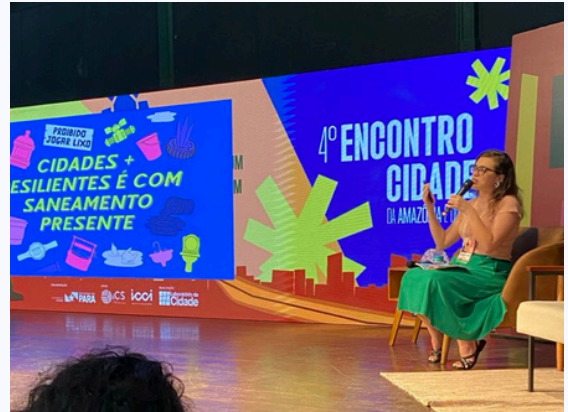
Apresentação da Pesquisa Água, Saneamento e Clima durante o 4º Encontro Cidades