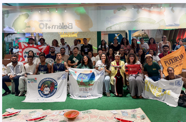
BEG "Olhos d'Água: das nascentes aos rios" durante a COP30 - Belém.