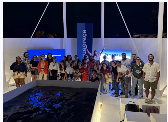
Painel "Dia Mundial do Banheiro: reflexões de uma Amazônia Urbana durante a COP30