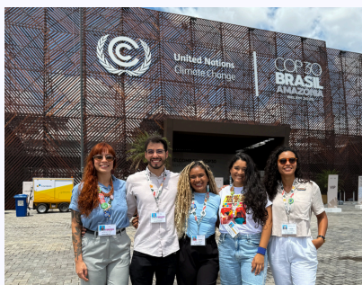
Equipe Mandí na Blue Zone durante a COP30 - Belém (2025).