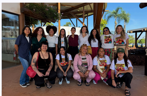
MANAS de Belém e Rio de Janeiro no BEG - Mulheres, Climas e Biomas, durante a PRÉ-COP em Brasília