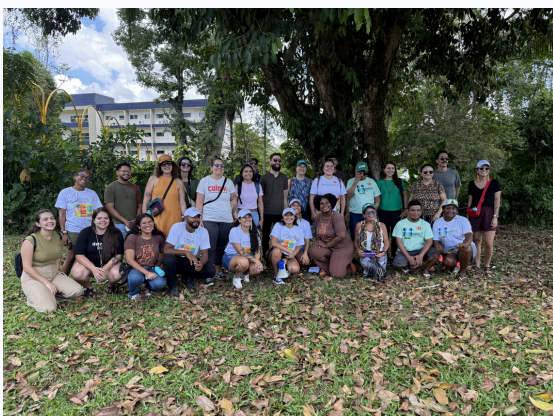
Expedição Tucunduba durante a COP30