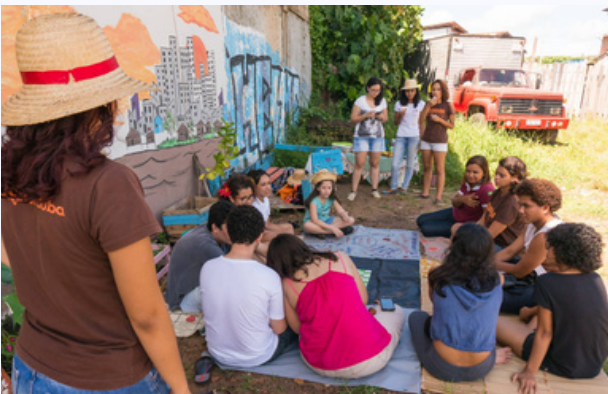
Atividade realizada às margens do Rio Tucunduba, quando a organização ainda era Coletivo Ame o Tucunduba (2017).

Este relatório é fruto disso, apresentando os principais resultados, movimentos e aprendizados do período, a partir de uma leitura integrada entre dados, atuação política e fortalecimento institucional.