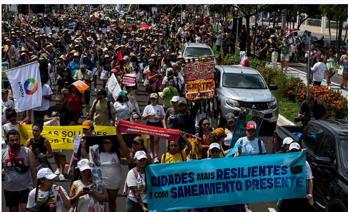
Marcha Global pelo Clima durante a COP30 em Belém.