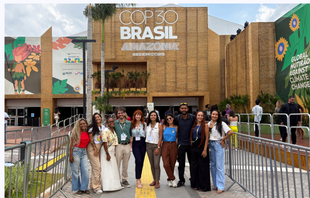
Parte da equipe da Mandí participando da COP30, em Belém- Pará (2025).