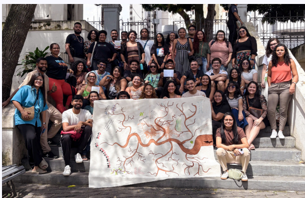
Oficina de Cartografia Social em Belém

Iniciando nossa atuação na região Nordeste do país, fomos convidadas pela Action Aid Brasil, realizadora do projeto, para integrarmos uma coalizão com Coletivo Caranguejo Tabaires (Recife/PE) e Conselho Pastoral dos Pescadores (BA/SE). A iniciativa teve como propósito fortalecer territórios e comunidades que vivenciam violações de direitos humanos na atuação em seus territórios e incidência política, assim como construir conexões entre regiões do Norte e Nordeste a partir das águas;