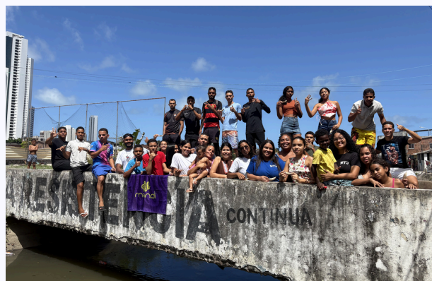
Oficina de Comunicação em Recife