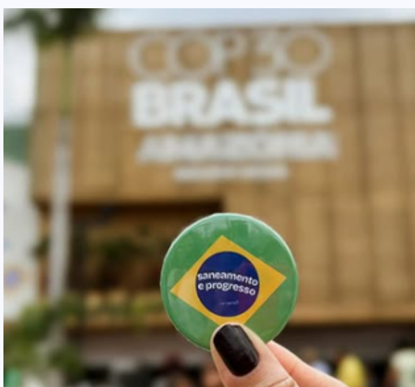
Bottom com a mensagem "Saneamento e Progresso" da campanha cidades resilientes