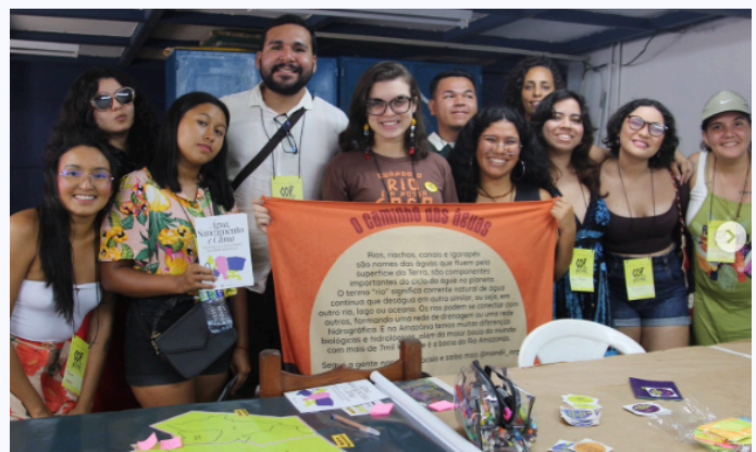
Encontro: Proteção e Vanguarda dos Rios Urbanos durante a COP das Baixadas, em Belém