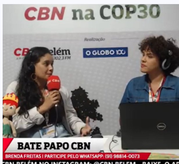
Diretora presidente da Mandí em entrevista durante a COP30