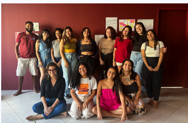
Encontro MANAS Belém

Dando continuidade a parceria com o Instituto Decodifica e apoiado pela Hivos, o projeto seguiu para o seu segundo ciclo. Estrategicamente pensado para culminar na COP30, às ações desenvolvidas contemplaram o reengajamento e mobilização das participantes (que completaram o ciclo anterior), treinamento sobre mudanças climáticas, formação sobre incidência política e a construção de um plano de advocacy para o grupo.