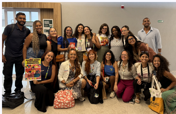
Mandí, Decodifica e Rede Manas na COP30