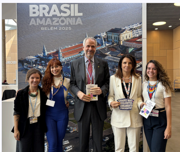
Entrega da pesquisa ao presidente da COP 30, André Corrêa, e à Ana Toni, Secretária Nacional de Mudanças Climáticas do Ministério do Meio Ambiente e Mudanças Climáticas do Brasil e diretora-executiva da COP 30 durante a Conferência de Bonn

Com apoio do iCS (Instituto Clima e Sociedade), a campanha, que avança para o seu segundo ano, se tornou um instrumento de incidência política da organização. A partir do lançamento da pesquisa “Água, Saneamento e Clima”, concentramos nossos esforços no fortalecimento e presença em redes de articulação nacionais e internacionais para posicionar o Brasil na COP30 enquanto uma liderança global que considera Saneamento, Amazônia e Justiça Climática de forma conectada.