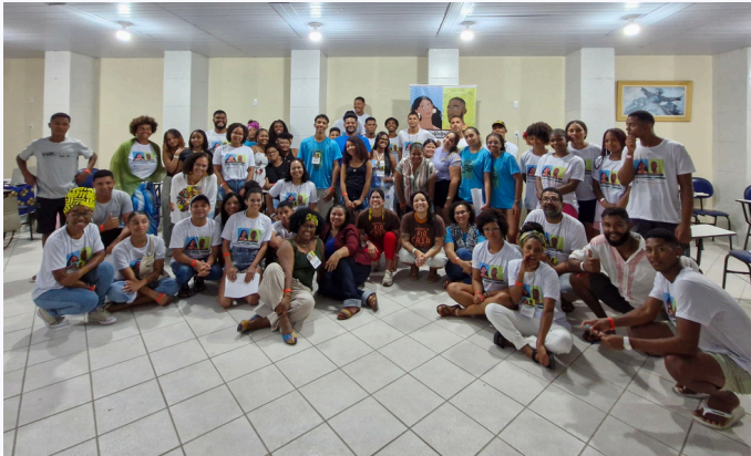
Oficina de Comunicação em Salvador