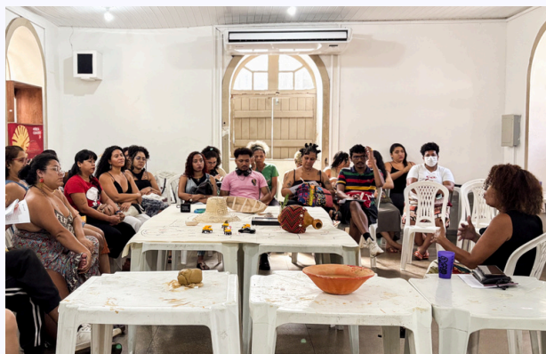
Oficina de Cartografia Social com organizações parceiras.

2 ações em parceria com atores estratégicos do Sul Global.